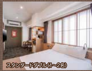
スタンダードダブル(1~2名)