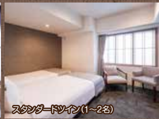
スタンダードツイン(1~2名)