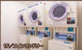
1F/コインランドリー