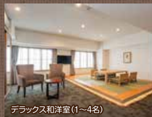
デラックス和洋室(1~4名)