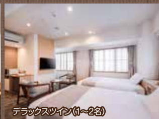
デラックスツイン(1~2名)

和モダンをコンセプトに、それぞれのお部屋はゆったりと落ち着いたデザインです。ビジネス、観光での滞在中、ごゆっくりとお寛ぎください。 ■上記以外に、車椅子をご利用のお客様に手すりを各所に設置した「ユニバーサルツイン」もご用意しております。お気軽にお問い合わせください。