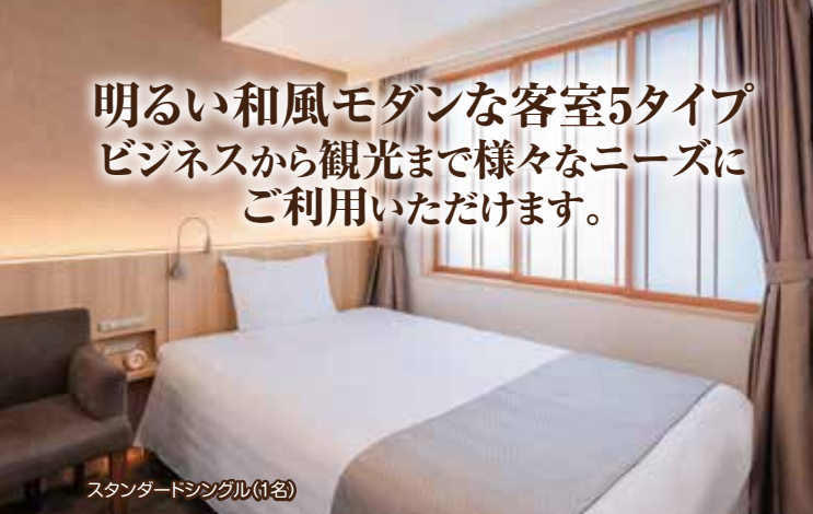
スタンダードシングル(1名)