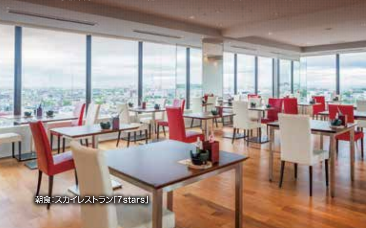
朝食:スカイレストラン「7stars」

旬の食材をふんだんに調理した朝食膳です。 苫小牧の名産「ホッキ貝」の一品料理は、新鮮でふりぶりの食感を楽しめます。 北海道の自社農園で育てた新鮮な野菜を使ったサラダやドリンクなど、 「和～なごみ～膳」プラス「プチバイキング」形式で食べるお得な朝食膳です。 苫小牧市内を一望できる11階スカイレストランから、爽やかな1日が始まります。