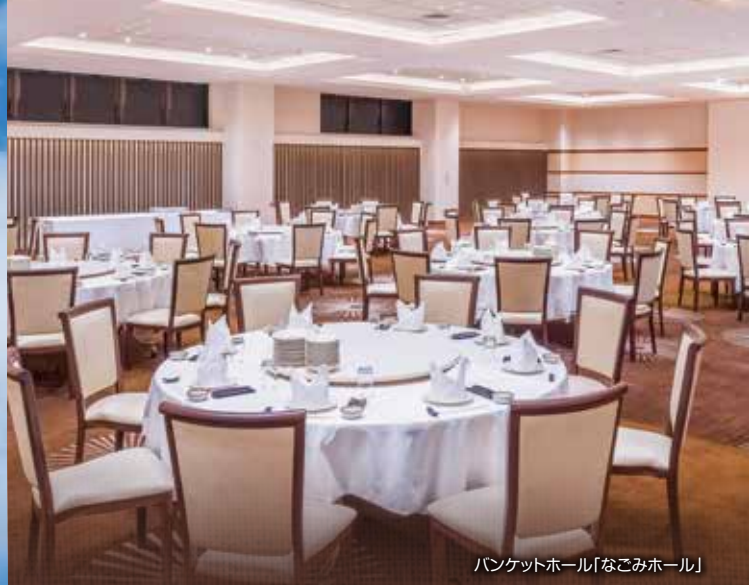
バンケットホール「なごみホール」

2階フロア 会議、研修、学会、講演会等 最大200名様までご対応可能な大ホールから少人数の各種会議室