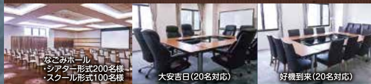
なごみホール ・シアター形式200名様 ・スクール形式100名様